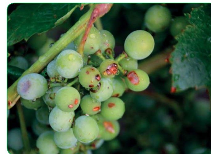
Obr.3 Po poškodení krúpami či ľadovcom je nutná dezinfekcia rán a nabudenie obranných mechanizmov viniča. Odporúčame Vincare v dávke 2 kg/ha.

a preto je možné ho využiť v systéme pestovania mimo Integrovannej produkcie až 6 x za vegetáciu.