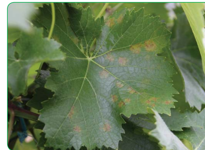
Obr.2 Postupujúca infekcia peronospóry môže pri vysokom infekčnom tlaku zničiť nielen listovú plochu viniča...

Naše odporúčanie: Vincare je náš fungicíd s najširším aplikačným intervalom vo vinohradoch (BBCH 01–85). Svoje uplatnenie nájde tam, kde je potrebné zmeniť kvôli riziku vzniku rezistencie účinné látky, taktiež ak vinohrad postihne ľadovec/krupobitie. Prípravok je ohľaduplný voči necieľovým užitočným organizmom. Riziko vzniku rezistencie je vzhľadom na zloženie nízke