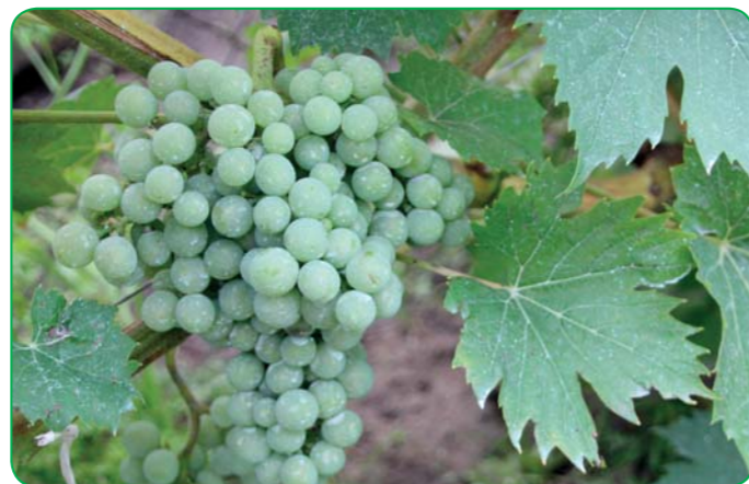
Obr.1 Použitím fungicidu MOMENTUM TRIO sledujeme zachovanie dlhodobo zdravej a funkčnej listovej plochy a zdravé strapce viniča.

Spektrum účinku: peronospora viniča, vedľajší účinok biela hniloba, červená spála, čierna škvrnitosť, pleseň sivá preventívne.