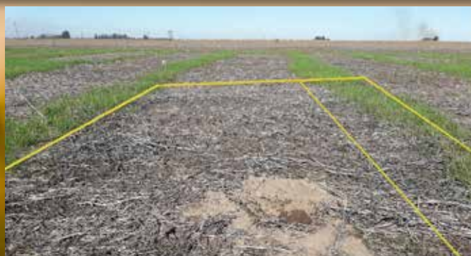
MAYORAL 300 CC + glifosato