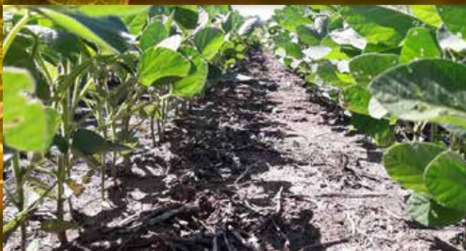
Tailwind 2,5 Lt/ha. 50 DDA. Victoria, ER.