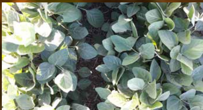
Tailwind 2,5 L/ha. 60 DDA.