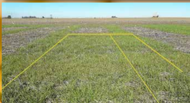
Glifosato 48 % 2500 CC

Control de LOLIUM RG en barbecho largo a soja. CBAgro. Zavalla, Santa Fe. Campaña 17-18