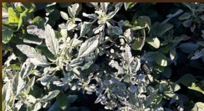
Testigo. Amaranthus por encima del canopeo. Crespo. Entre Ríos.