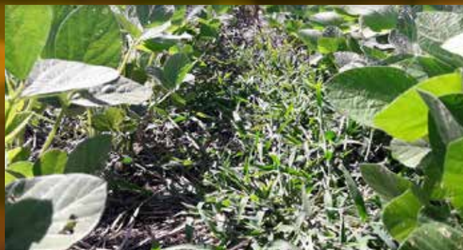
Testigo. Echinochloa colona, Digitaria sanguinalis, Eleusine spp.