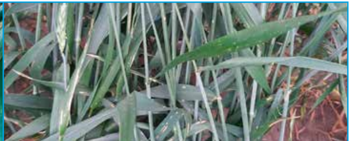
Custodia T (Z32) + Coverfull Ace (Z39)