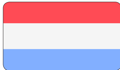
LUXEMBURG / LUXEMBOURG