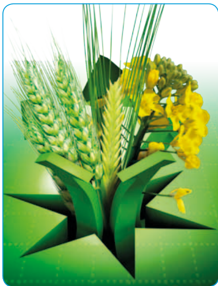
Vyhlička dobré úrody

Fungicid ve formě suspenzního koncentrátu k ochraně obilnin proti listovým chorobám, řepky olejky proti houbovým chorobám a bramboru proti kořenomorce bramborové a koletotrichovému vadnutí brambor.