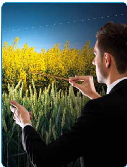
Uřídí zdraví i výnos

Fungicidní přípravek ve formě emulgovatelného koncentráту určený k ochraně pšenice ozimé a řepky olejky proti houbovým chorobám.