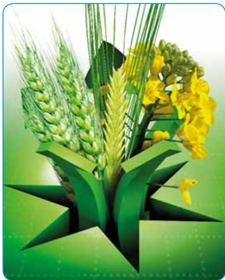
Vyhlička dobré úrody

Fungicid ve formě suspenzního koncentrátu k ochraně obilnin proti listovým chorobám, řepky olejky proti houbovým chorobám a bramboru proti kořenomorce bramborové a koletotrichovému vadnutí brambor.