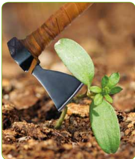
Na svízel. Kdykoliv.

Postřikový herbicidní přípravek ve formě emulgovatelného koncentrátu pro ředění vodou k postemergentnímu hubení odolných dvouděložných plevelů v obilninách bez podsevu, kukuřici, máku setém, v travách na semeno, loukách a pastvinách, okrasných a účelových trávnicích, travnatých hřištích, okrasných cibulovinách.