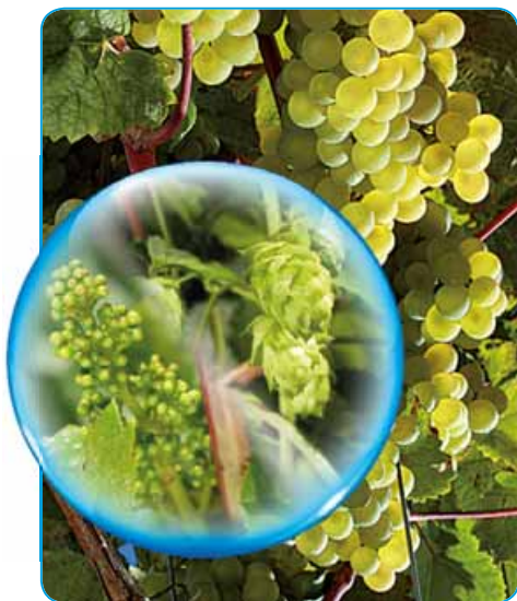
Základ ochrany révy vinné a chmele

Fungicidní přípravek ve formě granulí dispergovatelných ve vodě určený k ochraně révy vinné a chmele proti houbovým chorobám.