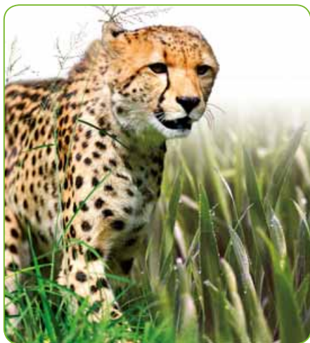
Nejrychleji působící graminicid

Selektivní postřikový graminicid ve formě emulgovatelného koncentrátu určený k postemergentnímu hubení trávovitých jednoletých a vytrvalých plevelů v cukrovce, bramborách, lnu, hrachu, hořčici, řepce ozimé i jarní, jeteli, vojtěšce, jahodníku, cibuli, zelí, mrkvi, slunečnici, bobu, pelušce, svazence, sadech, lesních kulturách a lesních školkách.