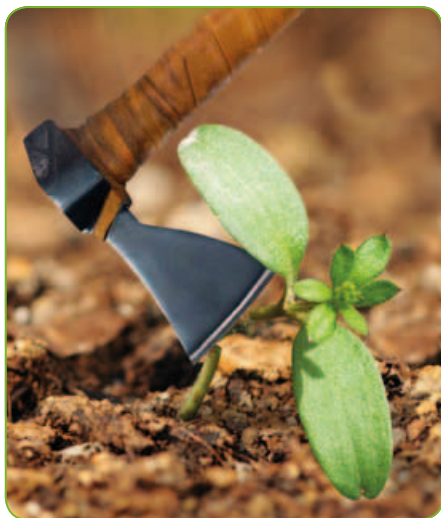
Na svízel. Kdykoliv.

Postřikový herbicidní přípravek ve formě emulgovatelného koncentráту pro ředění vodou k postemergentnímu hubení odolných dvouděložných plevelů v obilninách bez podsevu, kukuřici, máku setém, v travách na semeno, loukách a pastvinách, okrasných a účelových trávnících, travnatých hřištích, okrasných cibulovinách.