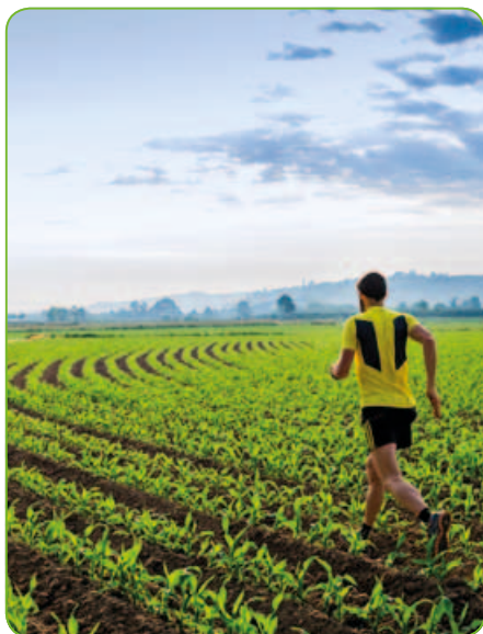
Cesta k čisté kukuřici

Postřikový herbicidní přípravek ve formě suspenzního koncentrátu pro preemergentní a postemergentní hubení jednoletých dvouděložných plevelů a ježatky kuří nohy v kukuřici.