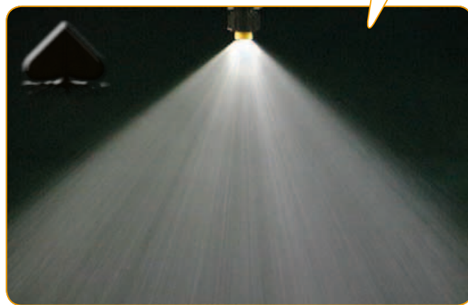
Herbicid + Grounded®, 200 l/ha, tlak 2 bar