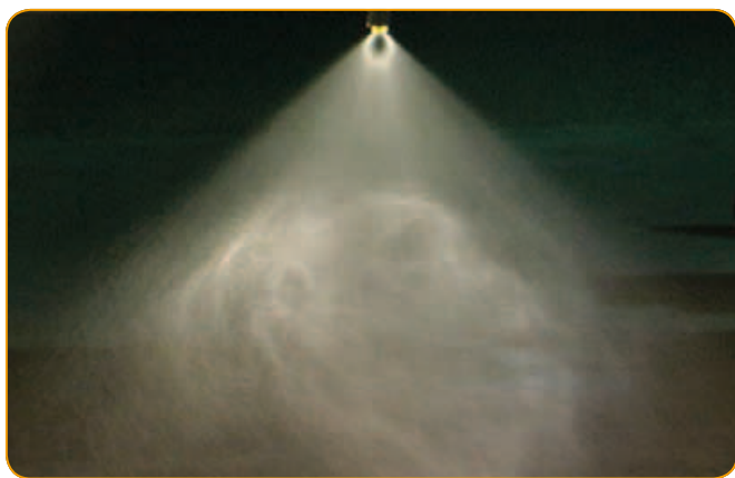
Herbicid samostatně, 200 l/ha, tlak 2 bar