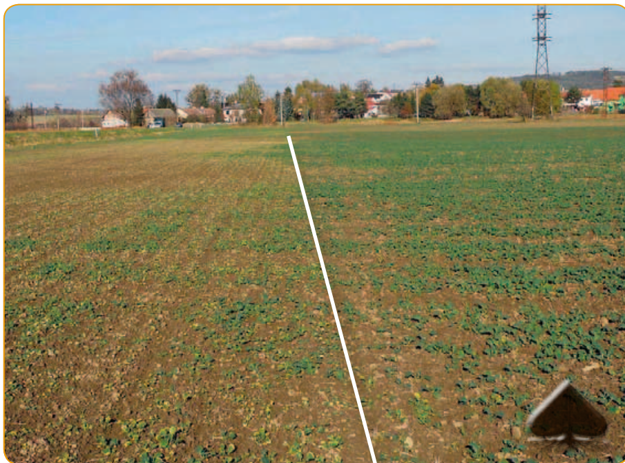
Grounded® výrazně omezuje vybělování řepky nadměrnými dávkami clomazone