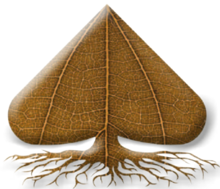
Pevné pouto s půdou

Smáčedlo ve formě emulgovatelného koncentrátu pro použití v zemědělství, zahradnictví a lesnictví. Je určeno ke zlepšení vlastností postřikových kapalin, snížení úletu při aplikaci, rovnoměrnému pokrytí ošetřovaného povrchu a zvýšení adsorpce účinné látky půdními částicemi. Snižuje riziko poškození plodiny a zlepšuje biologickou účinnost pesticidů, zejména herbicidů s reziduálním půdním účinkem.