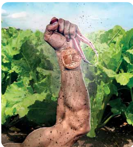
Titán v ochrane repy

Unikátny dvojzložkový herbicíd do repy cukrovej s významne vylepšenou formuláciou a predĺženým pôsobením proti jednoročným dvojkličnolistovým burinám.