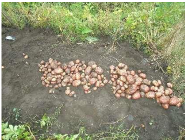
Evaluación a la cosecha 0,5 l/ha

Evaluaciones comparativas en el control de Gusano Blanco ( Premnotrypes vorax ) en el cultivo de papa ( Solanum tuberosum ), recomiendan usar GALIL a dosis de 1,25 cm 3 /l, obteniendo un control superior a aplicaciones tradicionales para esta plaga.