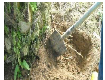
Monitoreo raíces 52 días