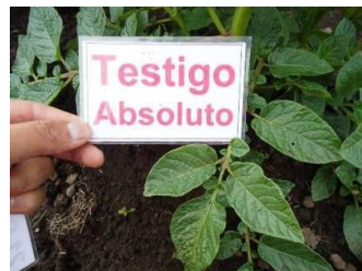
Evaluación Inicial TESTIGO A.