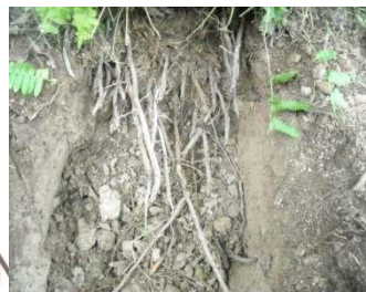
Monitoreo raíces 34 días