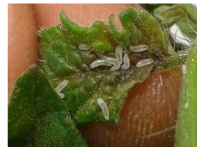
TESTIGO ABSOLUTO 7DDAI

Estudios realizados en el cultivo de Palma africana, para en el control ( Sagalasa valida ), recomiendan utilizar el insecticida GALIL a una dosis de 3,0 ml / palma