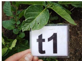
Evaluación Inicial 0,25 l/200 l agua

Evaluaciones comparativas de GALIL en el control de Pulguilla ( Epitrix cucumeris ) en el cultivo de papa ( Solanum tuberosum ), demuestran un control superior a aplicaciones tradicionales para esta plaga, a dosis de 1,25 ml / litro de agua.