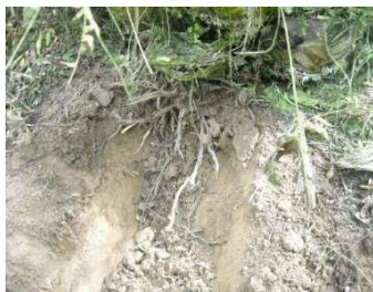
Monitoreo Inicial raíces

Estudios realizados en el cultivo de Palma africana, para en el control ( Sagalasa valida ), recomiendan utilizar el insecticida GALIL a una dosis de 3,0 ml / palma