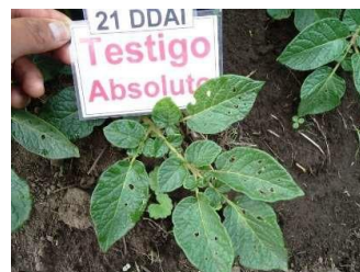
Evaluación 21 DDAI TESTIGO A.

Evaluaciones comparativas de GALIL en el control de Mosca Blanca ( Bemisia tabaci ) en el cultivo de Tomate ( Lycopersicon esculentum ).