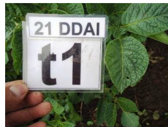
Evaluación 21 DDAI 0,25 l/200 l agua