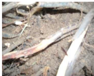
Monitoreo raíces 15 días