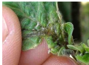
Galil 0,3 l/ha 7DDAI