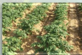
RACER® 25 EC