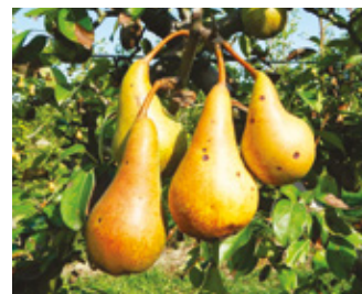
Danni da Maculatura su Pero