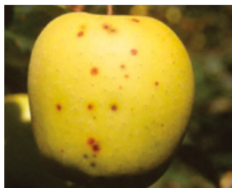
Danni da Alternaria su Melo