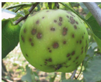
Danni da Ticchiolatura su Melo

BANJO® è un fungicida efficace nei confronti della Ticchiolatura, dell'Alternaria e della Maculatura Bruna del Pero. Su Melo BANJO® ha un'eccellente attività contro l'alternariosi oltre che contro la ticchiolatura.