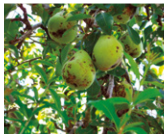
Danni da Ticchiolatura su Pero