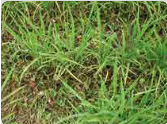
< 바사그란엠60 처리구 >