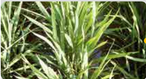
< 처리 43일 후 (8월 11일) >