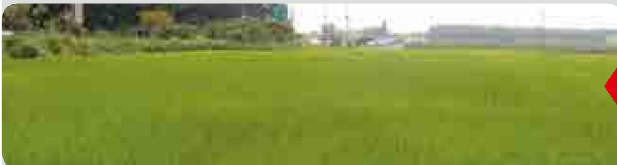
< 처리 50일 후 (8월 4일) >