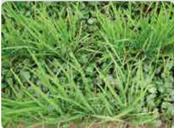
< 무처리구 >