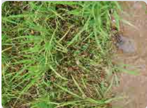
< 처리 7일 후 >