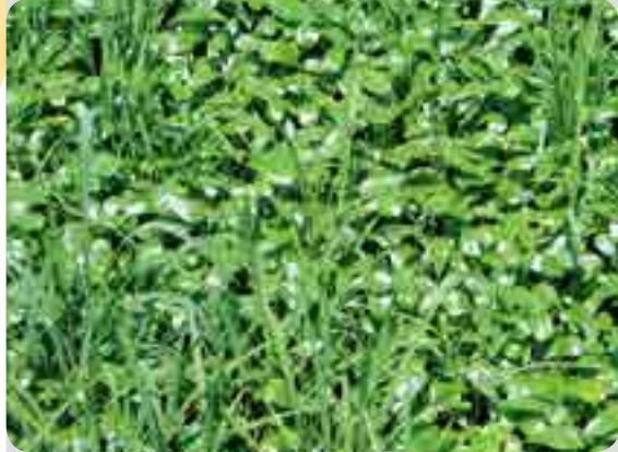
< 처리전 >