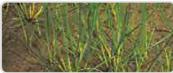
< 올방개 >

· 올방개, 벼풀과 같이 괴경이 큰 잡초들은 일반적인 제초제의 1회 사용으로는 방제가 어려워 방제가 곤란한 “난방제잡초”로 인식되어 있습니다.