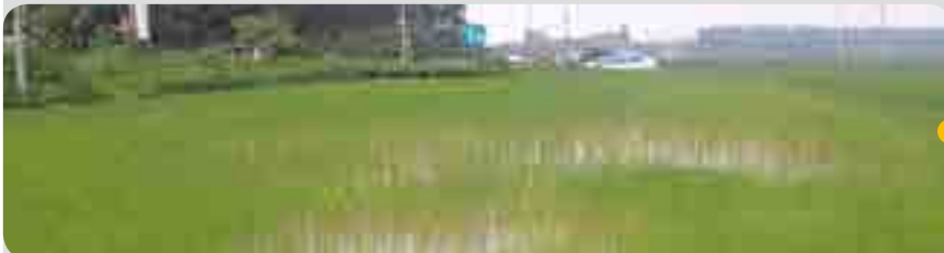
< 처리 28일 후 (7월 13일) >