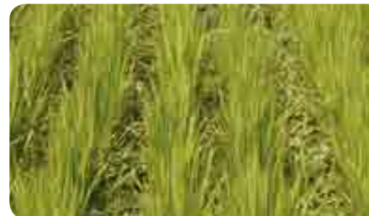
< 43일 후 (8월 11일) >