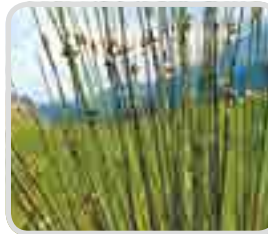
< 올챙이고랭이 >