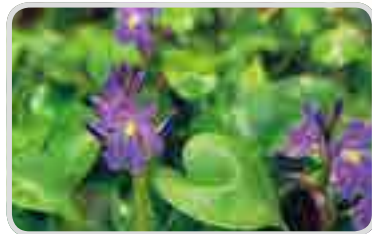
< 물옥잠 >