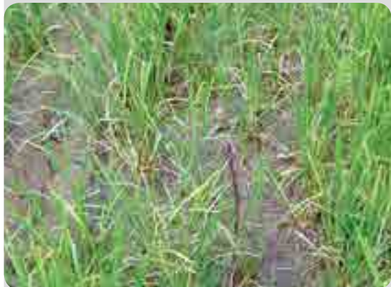
< 처리 13일 후 >