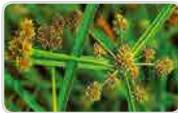
< 알방동사니 >