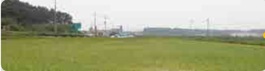
< 처리직전 (6월 16일) >