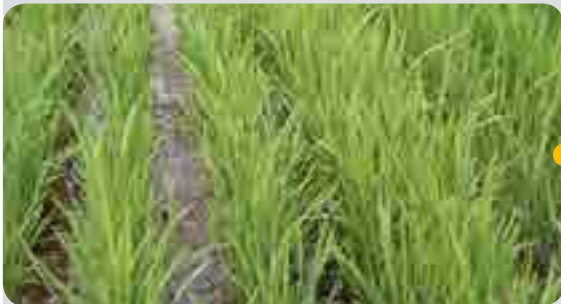
< 처리 6일 후 (7월 5일) >