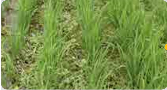
< 처리 1일 후 (6월 30일) >