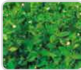
< 발뚝외풀 >