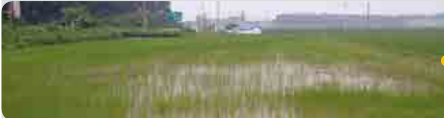
< 처리 20일 후 (7월 5일) >