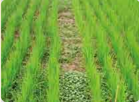
< 포장전경 >