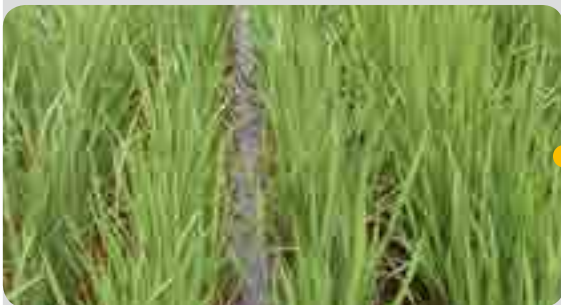
< 처리 14일 후 (7월 13일) >