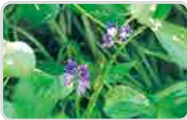
< 물달개비 >

· 현재 저항성 잡초로 인식되고 있는 잡초들은 물달개비, 알방동사니, 물옥잠, 미국외풀, 발뚝외풀, 올챙이고랭이, 마디꽃 등이 있습니다.