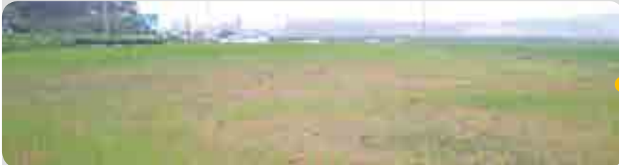
< 처리 12일 후 (6월 28일) >