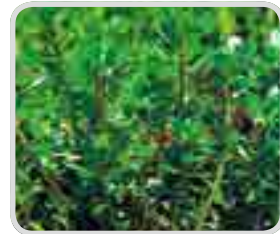
< 마디꽃 >