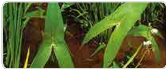
< 벼풀 >