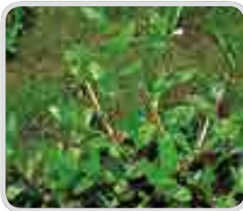
< 미국외풀 >