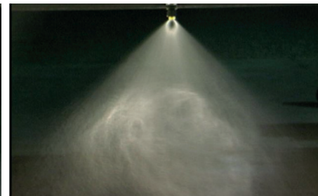
Herbicīds + GROUND ® , 200 l/ha, spiediens 2 bāri Tikai herbicīds, 200 l/ha, spiediens 2 bāri