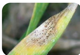
septorioza paskowana liści