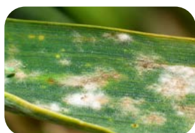
mączniak prawdziwy zbóż i traw