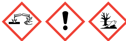
GHS05 GHS07 GHS09

Piktogramy określające rodzaj zagrożenia (CLP) :