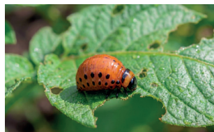
Larwy starsze (L3/L4) barwy pomarańczowej