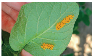
Jaja – za wcześnie