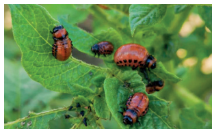
Młode larwy (L1/L2) barwy wiśniowej/czerwonej