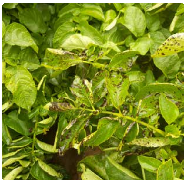
Контроль (без обработки)