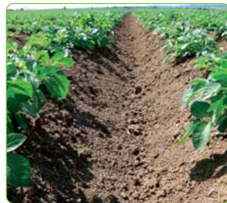
výsledok v zemiakoch