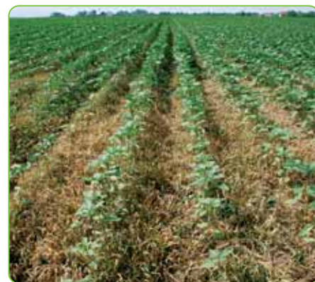
po aplikácii Agil 100 EC v slnečnici