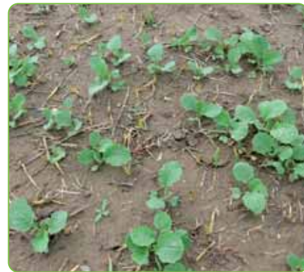
po aplikácii Agil 100 EC v repke

Na sóji, slnečnici alebo zemiakoch pri použití vyšších dávok herbicídu sa môžu na ošetrovaných listoch príležitostne vyskytnúť chlorotické škvrny. Tieto symptómy však rýchlo miznú a nemajú žiaden vplyv na ďalší rast, úrodu alebo kvalitu. Agil 100 EC je miešateľný s rôznymi fungicídmi, insekticídmi a herbicídmi. Pokiaľ je Agil 100 EC používaný v rámci postrekového sledu, musí byť dodržaný medzi aplikáciou iného herbicídu a Agil-u 100 EC interval najmenej 3 dni.