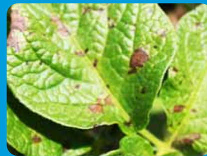
začiatok infekcie plesne zemiakovej

Využite výhody kontaktného prípravku BANJO s obsahom širokospektrálneho fluazinamu ako antirezistentného partnera do tank-mixov, s prípravkom RIVAL DUO .