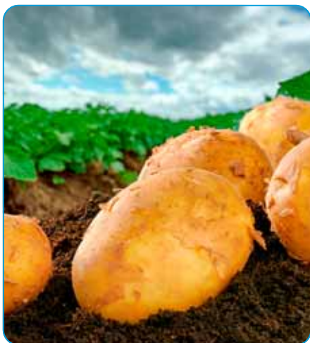
Dvakrát silnejší súper pre pleseň zemiakov

Systemový fungicíd s ochranným a kuratívnym účinkom určený na ochranu zemiakov proti plesni zemiakovej (Phytophthora infestans).