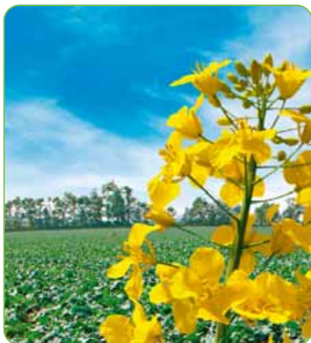
Top ochrana & bezpečnosť

Herbicíd vo forme suspenzného koncentrátu určený na preemergentnú a skorú postemergentnú kontrolu jednoklíčnolistových a dvojklíčnolistových burín v repke ozimnej.