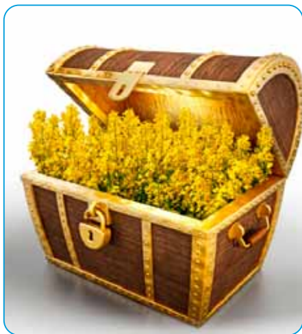
Váš poklad bude v bezpečí

Postrekový fungicídny prípravok vo forme suspenzného koncentrátu na ochranu repky olejnej proti bielej hnilobe a viniča proti múčnatke viniča.