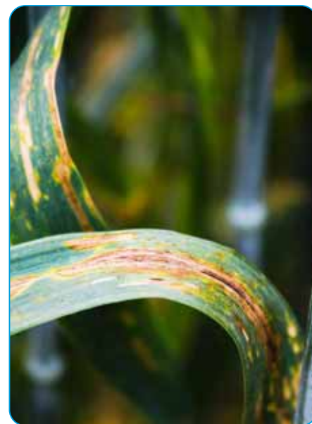
difenoconazole podporuje účinnosť proti hrdziam, septoriózam, fuzariózam, rynchospóriovej a hnedej škvrnitosti jačmeňa