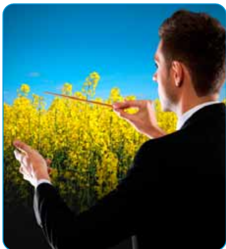
Symfónia D-dur pre obilniny a repku

Dvojzložkový systémový, fungicídny prípravok proti klasovým fuzariózam a ďalším chorobám listov a klasov obilnín, ako aj morforeguláciu a ochranu repky proti fómovej hnilobe.