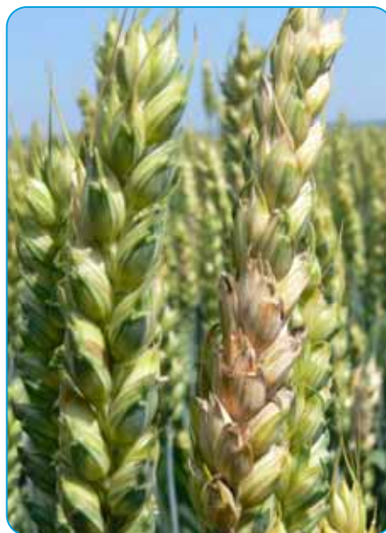
oficiálna registrácia proti fuzariózam klasu

Dirigent je pri dodržaní odporúčaní uvedených v etikeete veľmi šetrný k ošetrovaným plodinám.