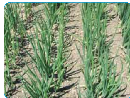
Kontroluje široké spektrum chorôb cibule

ako partner azolových prípravkov (tebuconazole, prothioconazole), ale využijete ho aj v TM s účinnou látkou prochloraz.