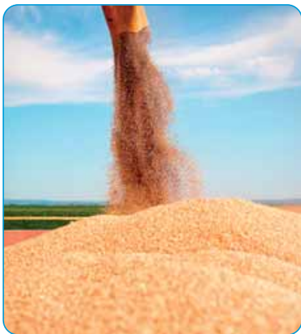
Vyhliadka dobrej úrody

Širokospektrálny fungicíd určený na ochranu pšenice ozimnej, jačmeňa jarného, repy cukrovej, slnečnice, repky ozimnej a repky jarnej, zemiakov, cibule, kapusty, brokolice, kelu a chmeľu proti hubovým chorobám.