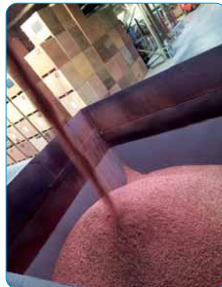
Moderná mikroemulzná formulácia zabezpečuje oteruvzdornosť aj po mesiacoch skladovania.