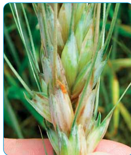
Fuzariózy v klase