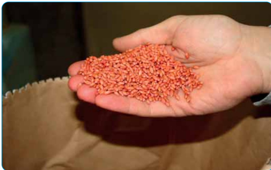
Vynikajúca príľnavosť, pokrývnosť, vyfarbenosť osiva a lesklý vzhľad.