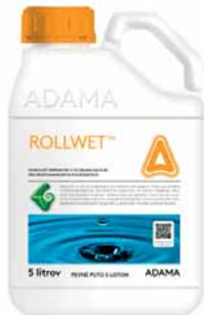
Pevné puto s listom

Adjuvant vo forme kvapalného koncentrátu pre riedenie vodou na použitie v poľnohospodárstve, záhradníctve a v lesníctve. Je určený pre zlepšenie vlastností postrekových kvapalín, zníženie úletu pri aplikácii, rovnomernému pokrytiu ošetrovaného povrchu a zlepšenie biologickej účinnosti pesticídov, predovšetkým kontaktných fungicídov a prípravkov na báze sulfonylmočovín.