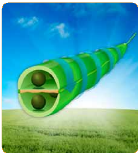
Dozrejú a neuniknú

Adjuvant určený pre obmedzenie predzberových a zberových strát repky olejnej, hrachu, fazule, bôbu, ľanu, slnečnice a sóje.