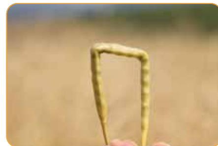
Správny termín pre aplikáciu adjuvantu Superfix

Po aplikácii nádrž, čerpadlo a hadice prepláchnite ne-iónovým čistiacim prostriedkom.