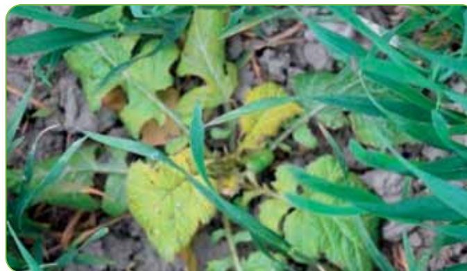
Trimmer je vhodný na dočistenie výmrvu repky