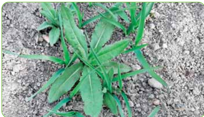
Spoľahlivo kontroluje pichliač roľný. Optimalne aplikujte vo fáze listovej ružice.