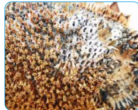
úbor slnečnice napadnutý bielou hnilobou