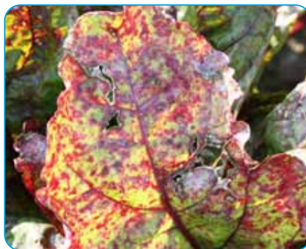
hnedá škvrnitosť listov repy