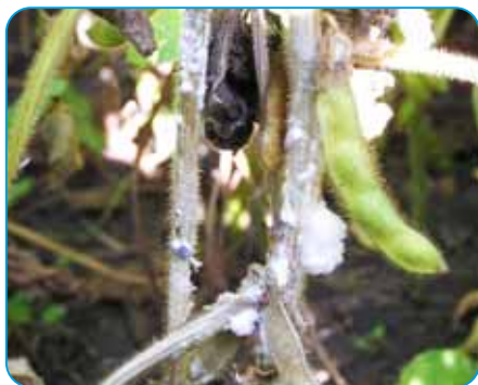
biela hniloba sóje

Interval medzi aplikáciami: min. 21 dní. Repu krmnú ošetríte od rastového štádia kompletného pokrytia pôdy – listy pokrývajú 90% pôdy (BBCH 39) až do termínu, keď koreň repy krmnej dosiahol zberovú veľkosť (BBCH 49). Posledné ošetrovanie by sa malo vykonať najmenej 35 dní pred plánovaným zberom. Obdo-