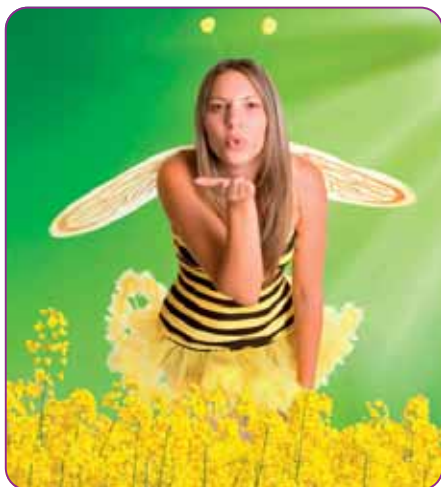
Blyskáčky vyrieši, včely poteší

Kontaktný insekticíd vo forme vodnej emulzie typu olej - voda určený na ničenie cicavých a žravých škodcov v chmeli, poľných plodinách, zelenine, viniči a v ovocných kultúrach.