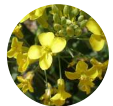
Sinapis alba MOSTAZA