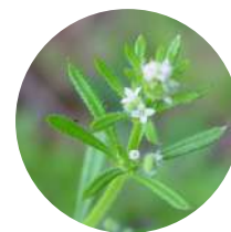
Gallium aparine LAPA