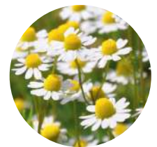
Matricaria chamomilla MAGARZA