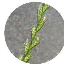
Lolium sp. VALLICO

La combinación de Pinoxaden con Clodinafop-Propargil ofrece un robusto control en post-emergencia de malas hierbas gramíneas en los cultivos de trigo. Además, la incorporación de Florasulam, herbicida selectivo para control en post-emergencia de las dicotiledóneas, aumenta el espectro de acción de Timeline® Trio. De esta forma, lo convierte en una solución completa en el control de las malas hierbas del trigo blando y del trigo duro.