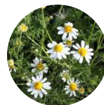
Anthemis arvensis MANZANILLA