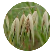
Avena fatua AVENA