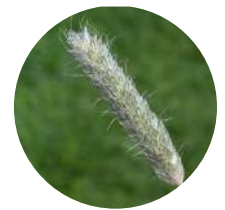
Alopecurus COLA DE ZORRA