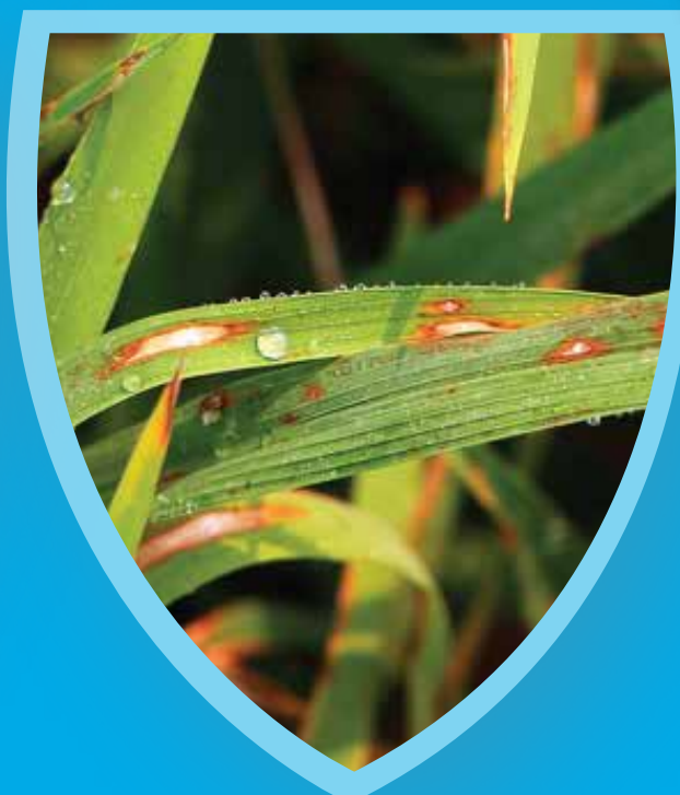
โรคใบไหม้

คู่คุณค่า. ด้วย 4 ปัจจัยเสริมเติมคุณภาพ เพิ่มผลผลิต