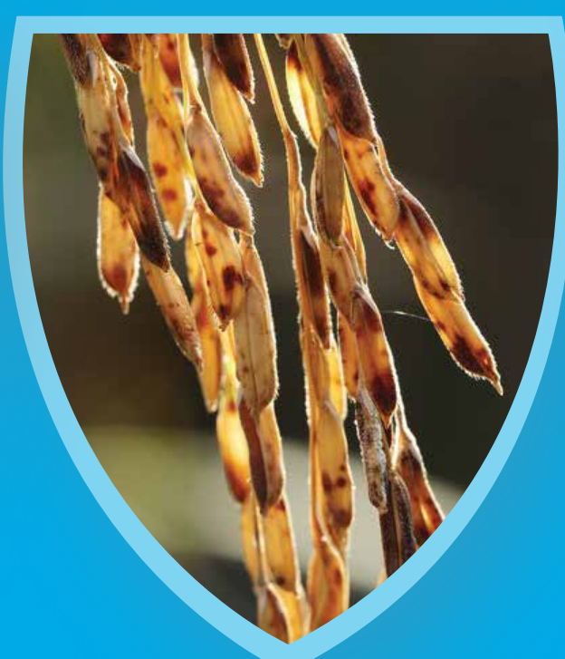
โรคเมล็ดต่าง