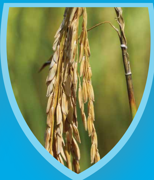
โรคไหม้คอรวง