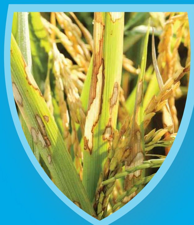
โรคราใบแห้ง

พลัง. ด้วย 2 พลัง ดูดซึม แทรกซึม สำหรับป้องกันกำจัดโรครา