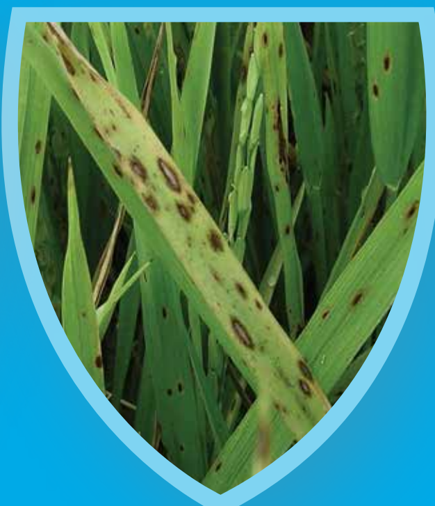
โรคใบจุดสีน้ำตาล