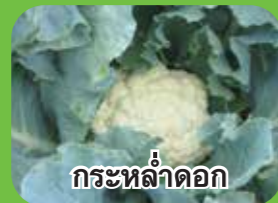
กระหล่ำดอก