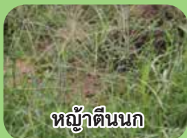
หญ้าตีนนก