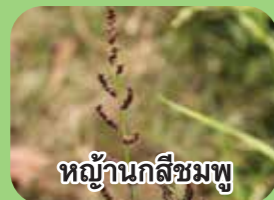
หญ้านกสีชมพู