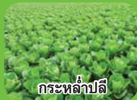
กระหล่ำปลี

ปลอดภัย ต่อพืชใบกว้าง สามารถพ่นทับได้ทันที