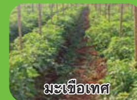
มะเขือเทศ