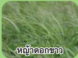
หญ้าดอกขาว