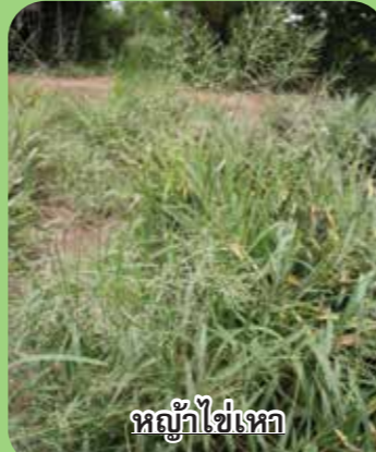
หญ้าไซ้เหา

ปลอดภัย ต่อพืชใบกว้าง สามารถพ่นทับได้ทันที