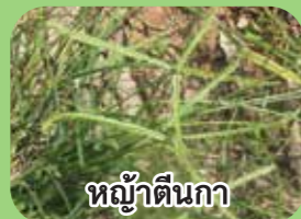
หญ้าตีนกา