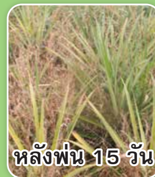
หลังพ่น 15 วัน