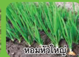
หอมหัวใหญ่