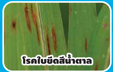
โรคใบขีดสีน้ำตาล