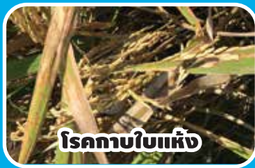
โรคกาบใบแห้ง