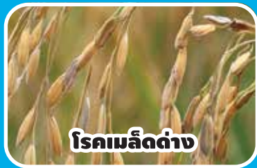
โรคเมล็ดดำ

ด้วยสองพลัง ดูดซึม แทรกซึม ป้องกัน กำจัดโรคราในข้าว ปกป้องผลผลิตทั้งภายนอกและภายใน ทำให้ได้ผลผลิตดี