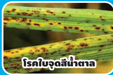
โรคใบจุดสีน้ำตาล