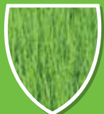
ใบเขียวแข็งแรง

ลดการทำงานของ สารซูเปอร์ออกไซด์ ทำให้ต้นข้าวเติบโตได้ดี