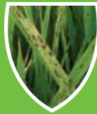
โรคใบจุดสีน้ำตาล