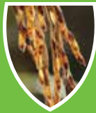
โรคมะไฟด่าง