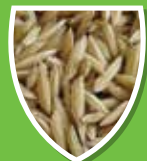
เมล็ดข้าวคุณภาพ