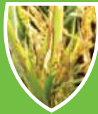
โรคมะไฟบนใบ