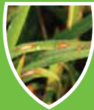
โรคใบไหม้