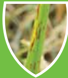
โรคใบขีดสีน้ำตาล