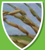
เมล็ดเขียว เดิมใคร