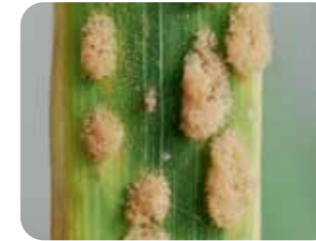
Tahıl küllemesi ( Erysiphe graminis )

İki farklı aktif maddenin mükemmel karışımı ile direnç yönetiminde güvenilir ortağınızdır. Ürününüzü koruyarak VERİM ve GELİRİNİZİN artmasına yardımcı olur.