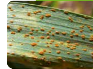
Kahverengi pas ( Puccinia recondita tritici )