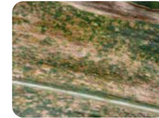
Septorya yaprak lekesi ( Septoria tritici )