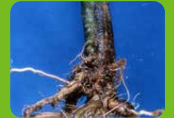
Kök ve kök boğazı çürüklüğü ( Fusarium spp. )