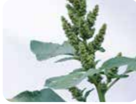
Kırmızı köklü tilki kuyruğu (Amaranthus retroflexus)