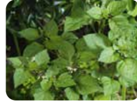
Köpek üzümü (Solanum nigrum)