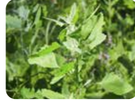
Sirken (Chenopodium album)