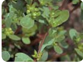
Semizotu (Portulaca oleracea)

COTTONEX® 500 SC fluometuron içerir. Fluometuron fotosentezi engelleyerek yabancı ot mücadelesinde etkili olur.