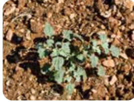
Bambul otu (Chrozophora tinctoria)