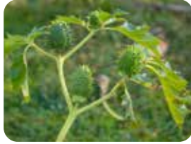
Şeytan elması (Datura stramonium)