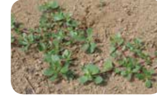
Yabani semizotu ( Portulaca sp. )