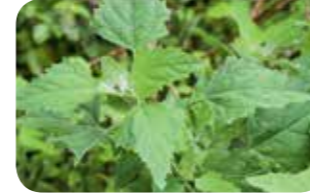
Sirken ( Chenopodium album )