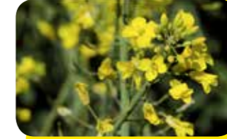
Yabani hardal ( Sinapis arvensis )