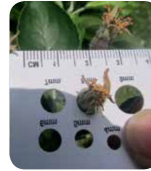
Meyve çapı 8-10 mm

Fotosentezin engellenmesi tutmuş olan meyvelerden çoğunlukla "kral" meyve tutumunu teşvik edip, yan meyvelerin düşmesine neden olur. Bu durumda kalan meyveler çap ve boyut olarak daha büyük ve kalitelidir.