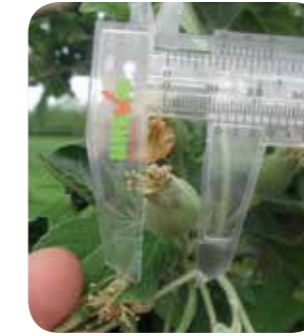
Meyve çapı 12-14 mm