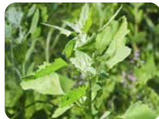
Sirken ( Chenopodium album )