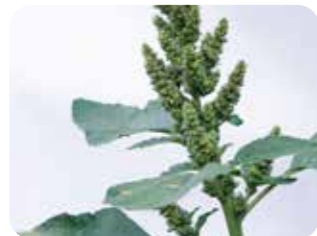
Kırmızı köklü tilki kuyruğu ( Amaranthus retroflexus )