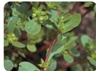
Semizotu ( Portulaca oleracea )