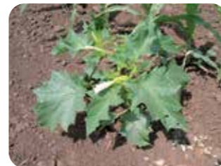
Şeytan elması ( Datura stramonium )