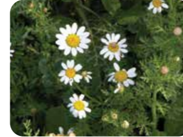
Hakiki papatya ( Matricaria chamomilla )