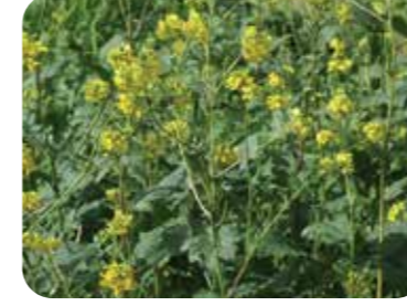
Yabani hardal ( Sinapis arvensis )

Mokka, 2 aktif maddenin mükemmel karışımı ile buğday yetiştiriciliğinde mücadelesi zorlu geniş yapraklı yabancı otları kontrol eden bir herbisittir. Bir çok dar yapraklı herbisit ürünü ile karışabilirliği olan Mokka'nın içeriğinde 360 g/l 2,4-D Asit ile 90 g/l Fluroxypyr bulunur.