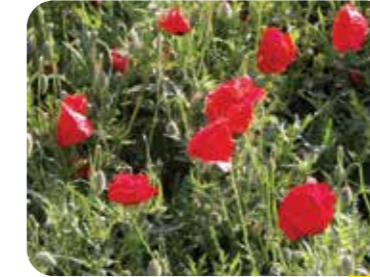
Gelincik ( Papaver rhoeas )