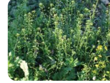
Çobançantası ( Capsella bursa-pastoris )