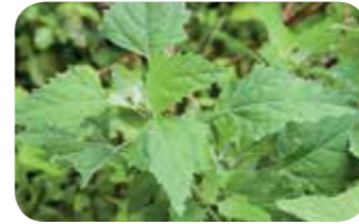
Sirken ( Chenopodium album )