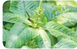
Kırmızı köklü tilkikuyruğu ( Amaranthus retroflexus )