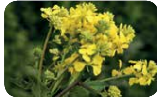
Yabani hardal ( Sinapis arvensis )

SE formülasyona sahip herbisitler şeker pancarı için yenilikçi ve gelişmiş bir uygulamaya sahiptir. Belvedere® Forte temel su bazlı suspo - emülsiyon formülasyonu ile sıvı içinde suspans halde bulunan katı parçacıklar ve küçük likit kürecikler sayesinde yabancı otların mumsu tabakasından kolayca içeri girer.