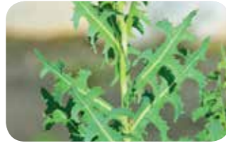
Yabani marul ( Lactuca serriola )