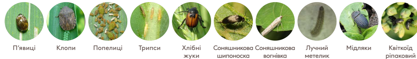
П'явиці Клопи Попелиці Трипси Хлібні жуки Соняшникова шипоноска Соняшникова вогнівка Лучний метелик Мідляки Квітоїд ріпаковий