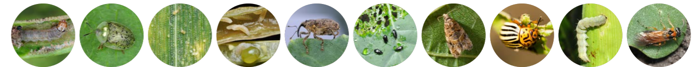
Бурякова мінуюча міль Щитоноски Павутинний кліщ Капустяний комарик Прихованохоботники Блішки Гронова листокрутка Колорадський жук Совки Ріпаківий пильщик

Препарат токсичний для бджіл, тому не рекомендується використовувати в період цвітіння медоносних культур.